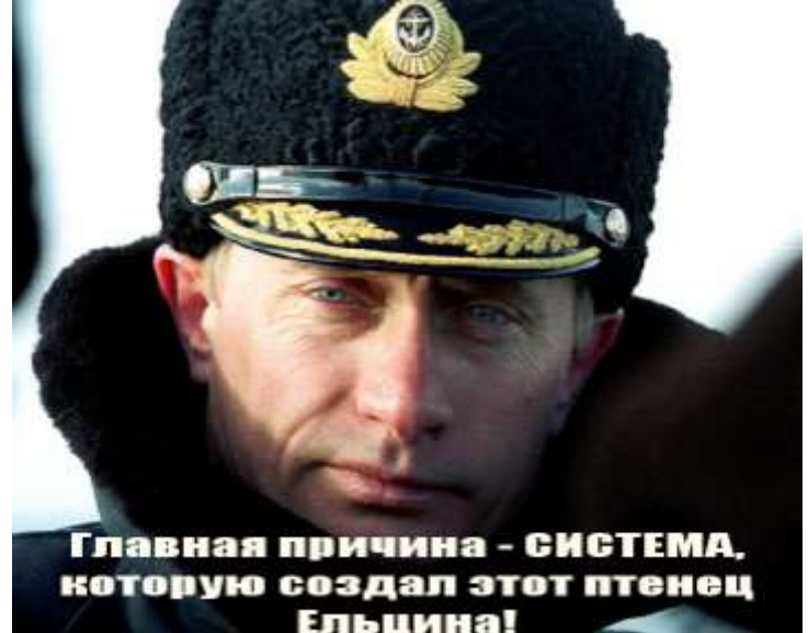
Главная причина - СИСТЕМА, которую создал этот птенец Ельцина!

В чём причина бесконечных схваток по всей стране на национальной почве? Причина в этой морской шапке, не имеющей никакого отношения к голове.