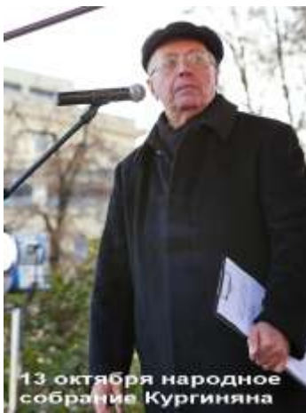
13 октября народное собрание Кургиняна

В то время, когда в Бирюлёво идёт схватка за достойную и безопасную жизнь в своём городе, Кургинян спокойно митингует в самом центре Москвы в окружении громадного числа военных и полиции.